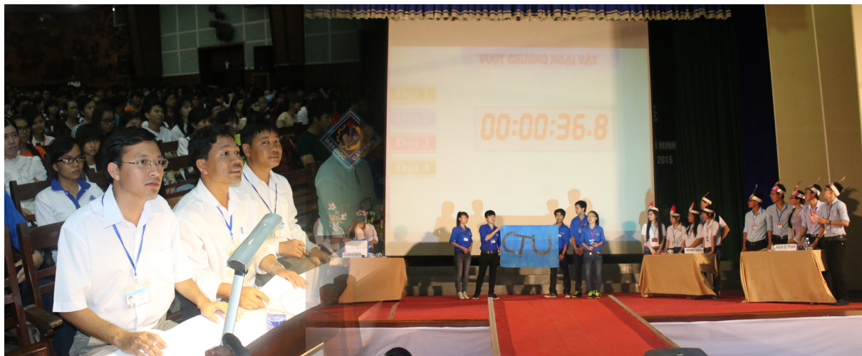
Sự thông thái của các đội thể hiện qua phần thi Vượt chướng ngại vật.