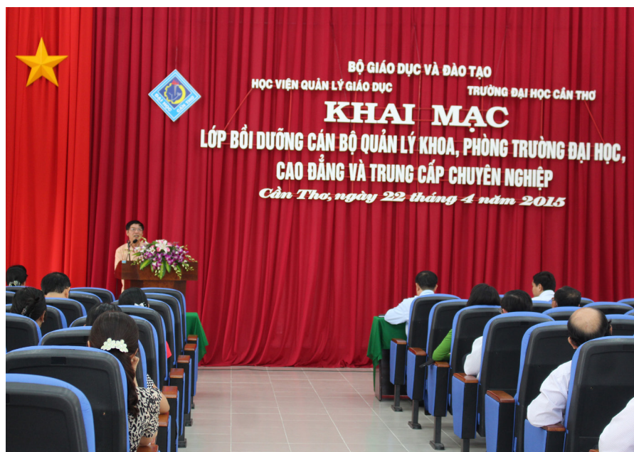
Toàn cảnh Lễ khai mạc Lớp bồi dưỡng cán bộ quản lý khoa, phòng trường đại học, cao đẳng và trung cấp chuyên nghiệp.