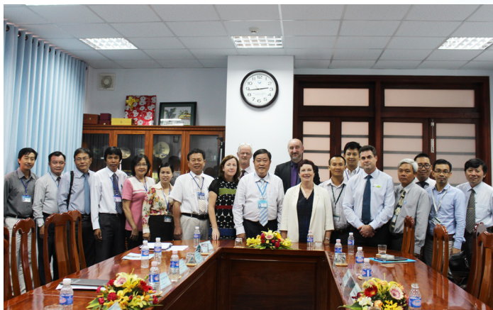
Ảnh lưu niệm tại buổi làm việc.

Sau bài giới thiệu, hai bên đã trao đổi về các cơ hội hợp tác nghiên cứu đặc biệt là trong lĩnh vực khoa học nông nghiệp. Phía Đại sứ quán Úc cũng chia sẻ, thông qua các chương trình học bổng của Chính phủ Úc và Việt Nam, ứng viên Trường ĐHCT có thể sang học tập tại các trường của Úc nhằm xây dựng nguồn nhân lực phù hợp với định hướng và mục tiêu nghiên cứu của Trường.