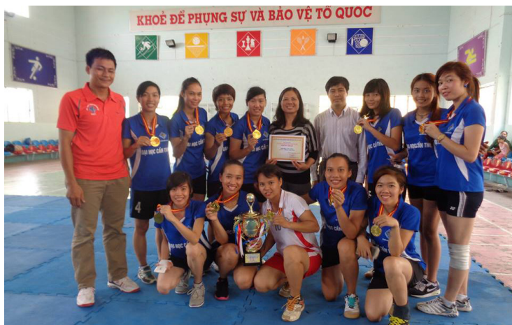
Ảnh lưu niệm tại cuộc thi.

Hội thao các trường đại học và cao đẳng khu vực Đồng bằng sông Cửu Long (ĐBSCL) lần thứ 23 được tổ chức nhằm kỷ niệm 40 năm ngày giải phóng miền Nam, thống nhất đất nước (30/4/1975 - 30/4/2015), đồng thời duy trì và thúc đẩy các phong trào thể dục thể thao (TDTT) rèn luyện sức khỏe-thể lực cho học sinh, sinh viên “ Khỏe để lập nghiệp-Giữ nước ” theo gương Bác Hồ vĩ đại; bên cạnh đó thúc đẩy mối quan hệ đoàn kết, hợp tác đào tạo, phát triển phong trào TDTT giữa các trường đại học, cao đẳng trong khu vực ĐBSCL, tạo điều kiện cho sinh viên có dịp giao lưu, học hỏi kinh nghiệm và nâng cao trình độ TDTT.