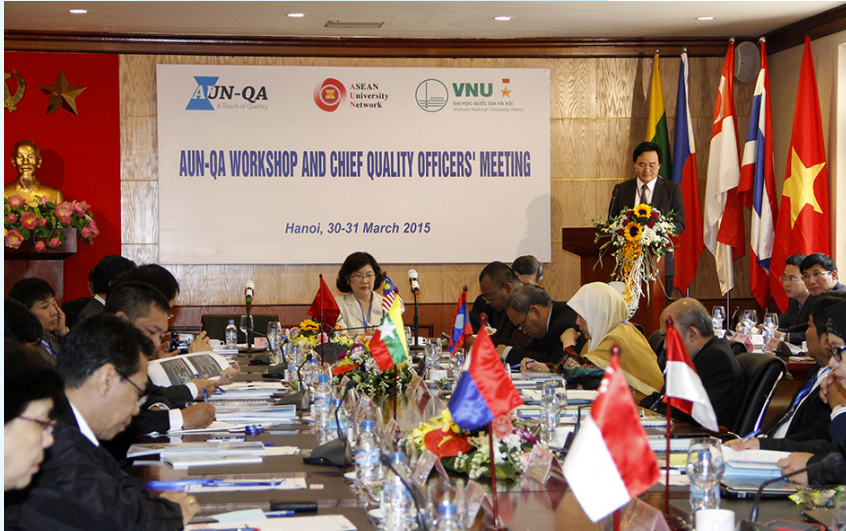
Hình ảnh Lễ Khai mạc Hội nghị AUN-QA CQO.

Trung tâm Đảm bảo Chất lượng và Khảo thí