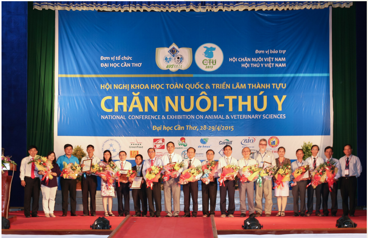
Vinh danh các tổ chức và cá nhân có nhiều đóng góp cho sự kiện.