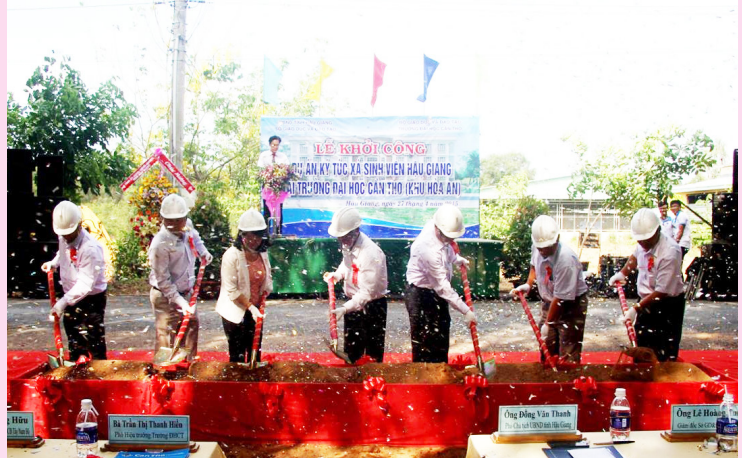
Các đại biểu làm lễ khởi công.

Trường ĐHTC trong suốt 49 năm qua đã nhận được nhiều sự hỗ trợ, đùm bọc của lãnh đạo và nhân dân các địa phương trong vùng về đầu tư xây dựng cơ sở vật chất, phục vụ tốt cho công tác giảng dạy, học tập của cán bộ và sinh viên. Trong đó, Hậu Giang là một trong những tỉnh có đóng góp lớn nhất trong việc xây dựng ký túc xá cho Trường. Năm 2014, tỉnh Hậu Giang đã xây dựng ký túc xá 05 tầng với quy mô hơn 550 chỗ ở cho sinh viên, tại Khu 2-Trường ĐHTC. Năm 2015, tỉnh Hậu Giang lại tiếp tục đầu tư xây dựng công trình ký túc xá có khả năng phục vụ việc ăn, ở và học tập cho 280 sinh viên tại Khu Hòa An của Trường. Điều này đã thể hiện tấm lòng yêu thương, đùm bọc của bà con, sự quan tâm của Ủy ban nhân dân tỉnh Hậu Giang dành cho Trường ĐHTC là vô cùng to lớn. Ký túc xá sinh viên Hậu Giang sẽ là một trong những cơ sở vật chất khang trang của Trường tại Khu Hòa An. Công trình được xây dựng sẽ góp phần nâng cao đời sống vật chất và tinh thần, nâng cao chất lượng học tập của