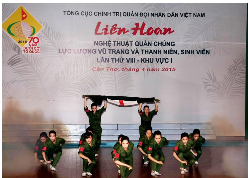
Tiết mục Múa “Những bông hoa trên tuyến lửa” đạt Huy chương Vàng.