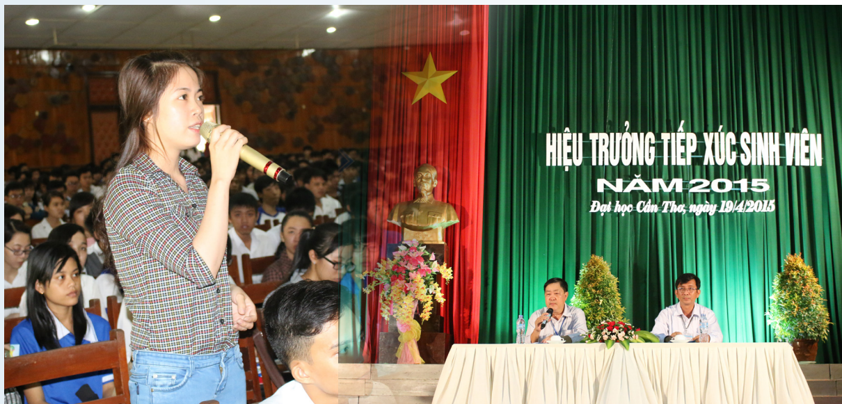
Tọa đàm giữa lãnh đạo nhà trường và sinh viên tại Hội trường Lớn.

N gày 19/4/2015, Trường Đại học Cần Thơ (ĐHCT) đã tổ chức buổi Tọa đàm “Hiệu trưởng tiếp xúc sinh viên” tại Hội trường Lớn. Tham dự buổi tọa đàm có các thành viên Đảng ủy, Ban Giám hiệu; đại diện lãnh đạo, chuyên trách, giảng viên các đơn vị; đại diện sinh viên là thành viên ban cán sự và ban chấp hành chi đoàn các lớp.