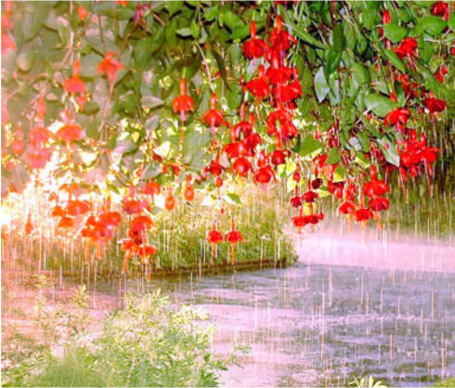
Ảnh minh họa.

Thuở học trò còn sống với gia đình đã qua đi, tôi thấy mình hạnh phúc thật nhiều khi được ở trong tình thương vô bờ bến. Khoảnh khắc thân thương dưới những gốc cây ghé đá sân trường một thời ghi dấu lại trong bao kí ức mộng mơ, nhớ phút chia tay bè bạn trong những buổi chiều tiếng mưa tưng bừng rộn rã, nhớ từng mái trường qua đi lại là cái phút giây mỗi độ cánh phượng hồng lá tả rời.