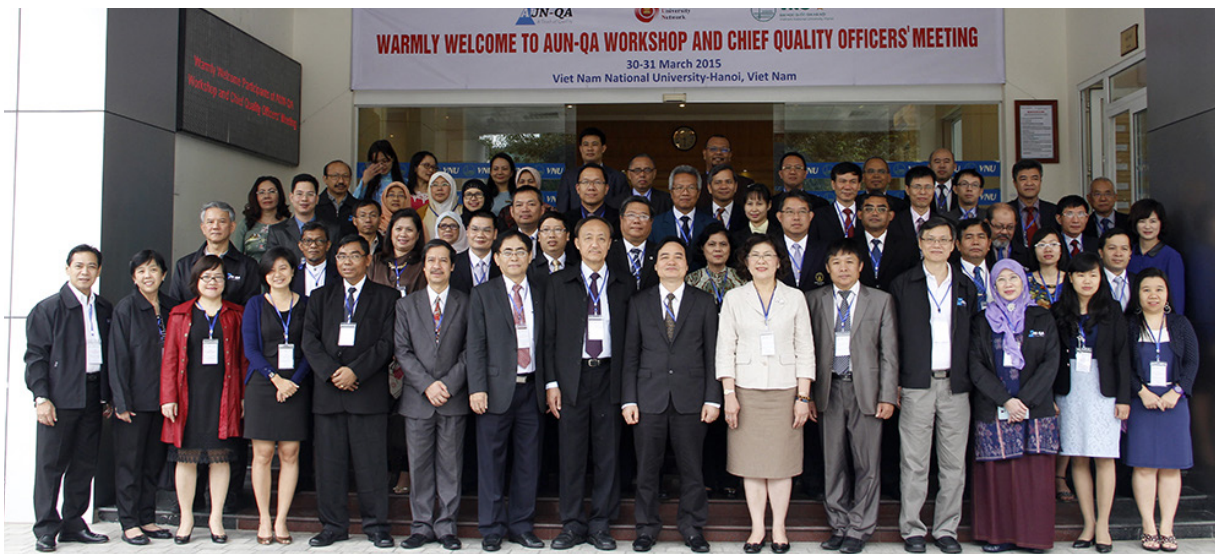
Ảnh lưu niệm các đại biểu trước Nhà Điều hành Đại học Quốc gia Hà Nội.

Hội nghị thường niên AUN-ACTS lần thứ VIII sẽ do Đại học Chiang Mai (Thái Lan) đăng cai tổ chức trong các ngày 18-19/02/2016.