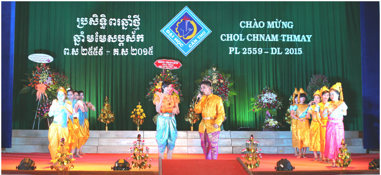
Tiết mục văn nghệ đặc sắc tại Chương trình “Chào mừng Tết cổ truyền Chol Chnam Thmay”.

Đêm 05/4/2015, Trường Đại học Cần Thơ (ĐHCT) đã tổ chức sinh hoạt văn hóa nghệ thuật “Chào mừng Tết cổ truyền Chol Chnam Thmay”. Chương trình vinh dự đón tiếp quý đại biểu đại diện lãnh đạo từ Ban Chỉ đạo Tây Nam Bộ, Vụ Địa phương 3, Ủy ban Mặt trận Tổ quốc, Ban Dân tộc, Hội đoàn kết sự sãi yêu nước, Hội Khuyến học các tỉnh, thành Đồng bằng sông Cửu Long, Phòng PB11 và PA83-Công An Thành phố Cần Thơ. Phía Trường ĐHCT có Đảng ủy-Ban Giám hiệu, đại diện lãnh đạo, viên chức các đơn vị và sinh viên Trường, đặc biệt với sự tham gia của hơn 1.000 cán bộ và sinh viên dân tộc Khmer.