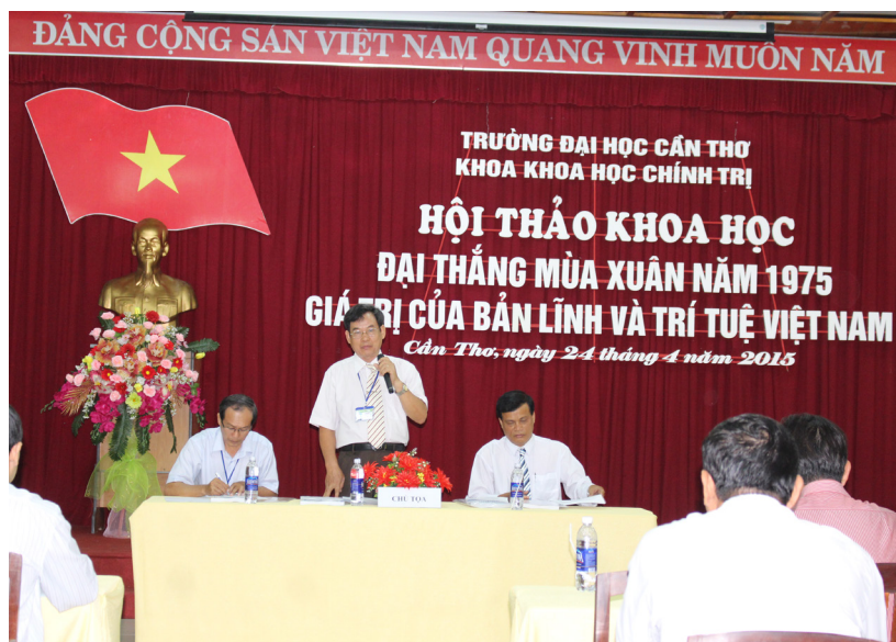
Toàn cảnh Hội thảo “Đại thắng mùa xuân năm 1975, giá trị trí tuệ và bản lĩnh Việt Nam”.

Tiến tới kỷ niệm 40 năm, ngày thống nhất đất nước (30/4/1975-30/4/2015), ngày 24/4/2015, Khoa Khoa học Chính trị- Trường Đại học Cần Thơ long trọng tổ chức Hội thảo khoa học với chủ đề “ Đại thắng mùa xuân năm 1975, giá trị trí tuệ và bản lĩnh Việt Nam ”. Đến dự Chương trình có sự góp mặt của đại biểu, khách mời, thầy cô cùng đồng đạo sinh viên Trường ĐHCT.