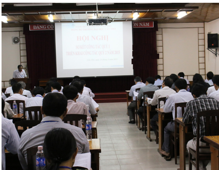
Hội nghị Đảng ủy mở rộng quý I năm 2015 diễn ra tại Hội trường II-Khoa Công nghệ Thông tin và Truyền thông.

Theo đó, Trường đã tiến hành một số hoạt động nổi bật đánh dấu bước phát triển quan trọng như: công bố đạt chuẩn AUN-QA đối với 02 chương trình tiên tiến ngành Công nghệ Sinh học và Nuôi trồng Thủy sản, khánh thành Nhà Điều hành Trường ĐHCCT, công bố quyết định thành lập Khoa Ngoại ngữ. Đặc biệt, Dự án “ Nâng cấp Trường Đại học Cần Thơ thành trường đại học xuất sắc về đào tạo, nghiên cứu khoa học và chuyển giao công nghệ ” bằng nguồn vốn ODA của Chính phủ Nhật Bản đã được ký