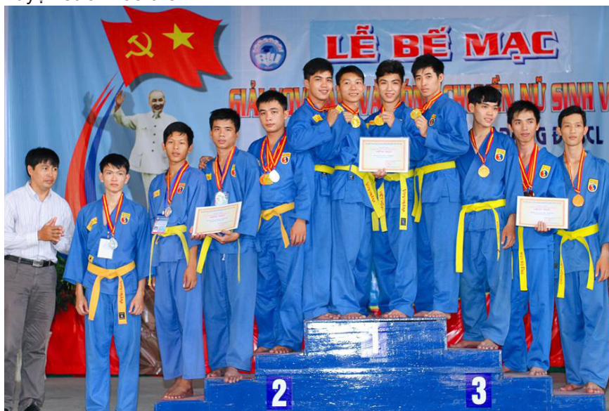
Đội tuyển sinh viên trường đạt nhiều giải thưởng xuất sắc tại Hội thao.

Trong đó, đoàn vận động viên Trường Đại học Cần Thơ với tinh thần thi đấu trung thực, cao thượng và hết mình đã đạt được 15 huy chương vàng, 11 huy chương bạc, 01 huy chương đồng đối với môn Vovinam, cúp vô địch môn bóng chuyền nữ và xuất sắc đạt giải nhất toàn đoàn, mang vinh quang về cho Trường.