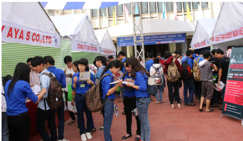
Sinh viên tham gia phiên giao dịch việc làm của các doanh nghiệp.

Trong chương trình ngày hội, sinh viên đã tham gia buổi tọa đàm với đại diện phía doanh nghiệp với chủ đề: “Cơ hội thách thức trong việc làm đối với sinh viên CNTT” và tham gia phiên giao dịch việc làm của các doanh nghiệp gồm TMA, Renesas, FPT SoftWare, Harvey Nash, AYA, và Deltasoft.